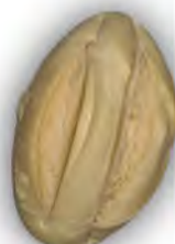
Bollo sev illano 150 gr ref:0268