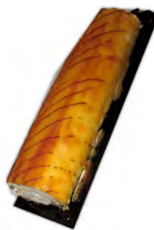
Brazo de yema ref: 1294