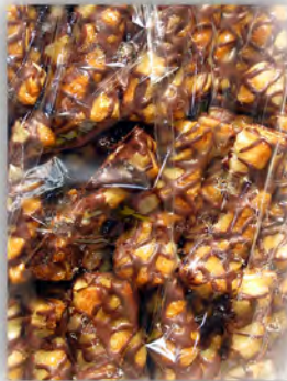
Lazos cebra ref: 1236