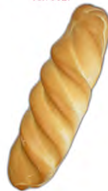
Libra brillo 330 gr. ref: 0002