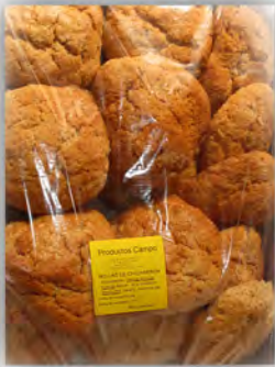
Bollas de chicharrón ref: 0664