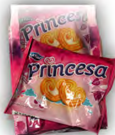
Princesa 1 € ref: 1282