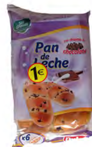
Pan de leche 1 € ref: 1275