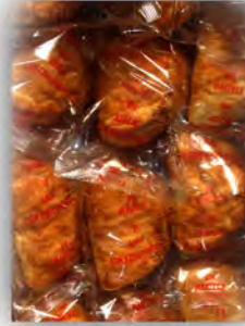
Empanada cabello de ángel sin azucar ref: 1240