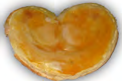
Palmerón de yema ref: 1224