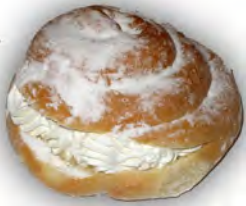
Bamba de nata ref: 1220