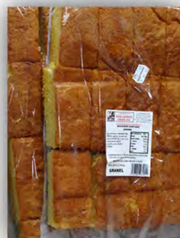
Bizcocho cortado a granel ref: 0662