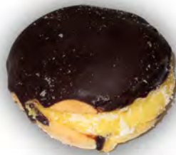
Bamba de choco ref: 1221