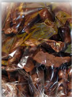
Lazos de chocolate ref: 0910