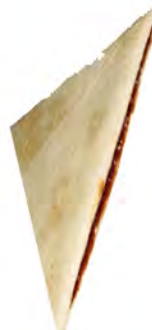
Triángulo choco ref: 0338