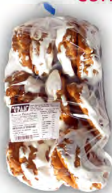
Bolsa de rosas Santa Clara ref: 0919