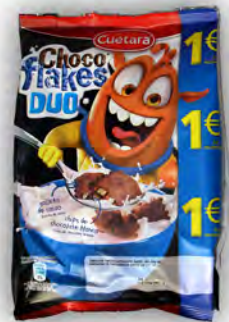
Choco flakes 1 € ref: 1266