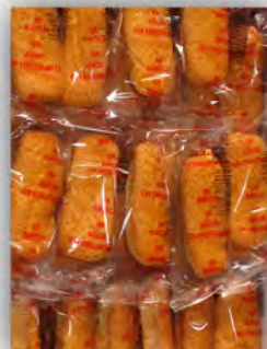
Valenciana sin azucar ref: 0691