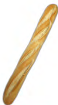
Baguette natural ref: 0703