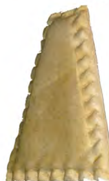
Triángulo york y queso ref: 0339