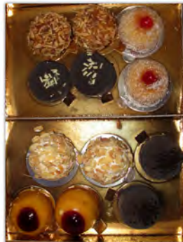
Surtido de Bombas ref: 1213