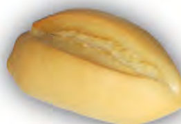
Bollo mediano 70 gr ref: 0010