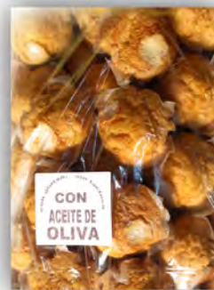
Mostachones sin lactosa ref: 0936