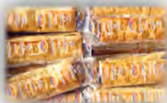
Caña choco integral sin azucar