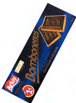
Bonbonetas 1 € ref: 1280