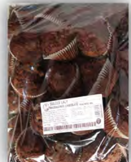
Magdalena choco sin lactosa ref: 0678