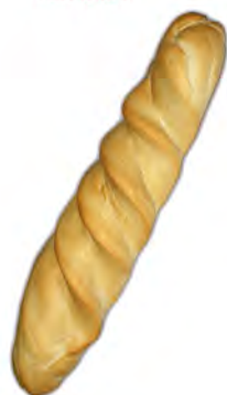
Libra de Plasencia 330 gr. ref: 0021