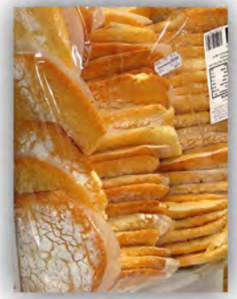
Bolluela de nata ref: 0644