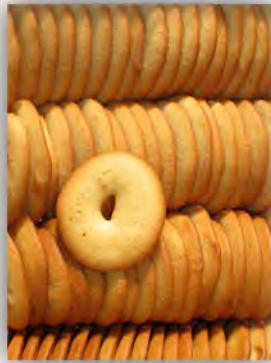
Rosquilla de huevo ref: 0942