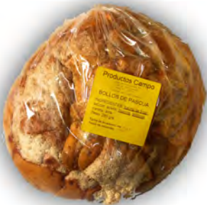
Bollo de pascua ref: 0524