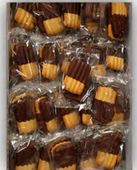
Galleta bombón ref: 0655