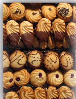
Pastas de te ref: 0911