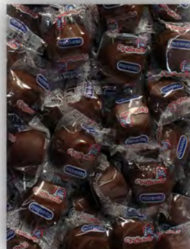
Morenitos ref: 0944