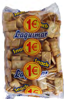
Regaña 1 € ref: 1276