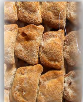
Empanadas el Cateto ref: 0979