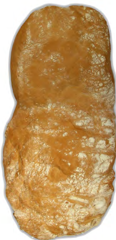
Chapatón grande ref: 0188 Pan cocido