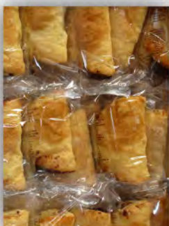
Empanada de hojaldre choco ref: 1231