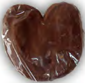
Palmera choco individual ref: 0508