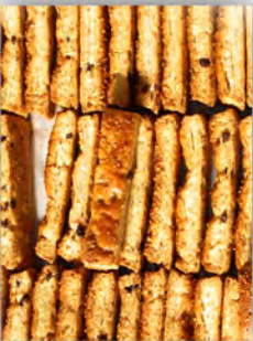
Barritas de cereales sin azucar ref: 0938