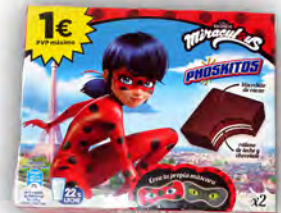
Phoskitos 1 € ref: 1267