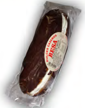
Suizo de nata ref: 1219