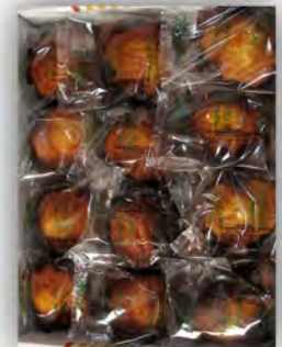
Magdalena de zanahoria sin azucar ref: 0863