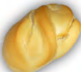
Bollo banquete 70 gr ref: 0031