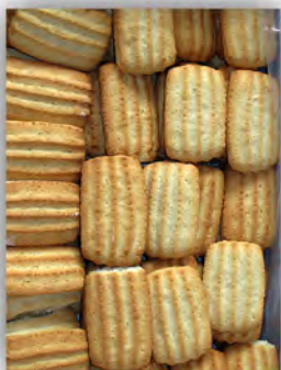
Galleta rizada ref: 0667