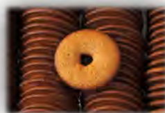
Rosca integral de huevo sin azucar ref: 0920