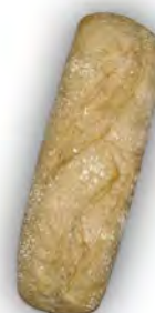
Chapata 150 gr ref:0264