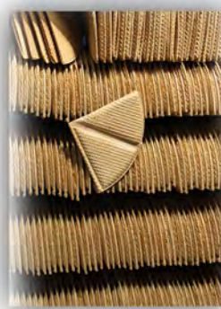
Abanicos de barquillo ref: 0939