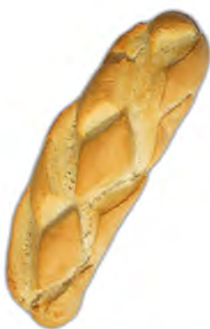
Libra cantona 330 gr. ref: 0026