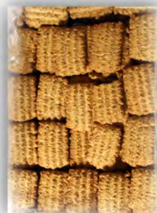
Galletas 8 cereales sin azucar ref: 0931