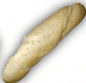
Pepito de media cocción 140 gr ref: 0006