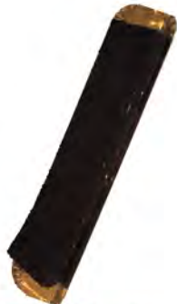
Banda de brawnie ref: 1288