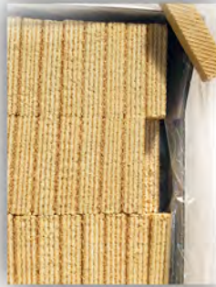
Boer coco ref: 0904