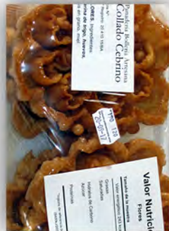
Bandeja de fletas ref: 0648