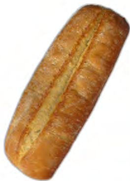
Libra chapata 330 gr. ref: 0015