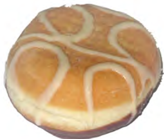
Berlina crema ref: 1103