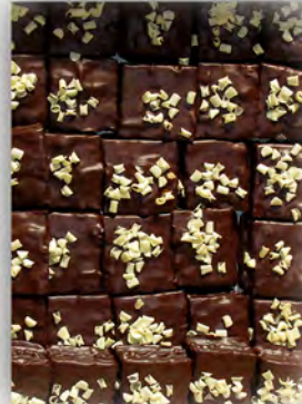
Rusos de crema ref: 0900