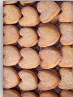
Mantecados ref: 0686