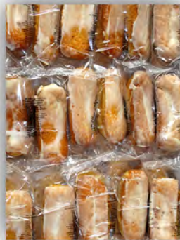
Sobaos crema ref: 0675