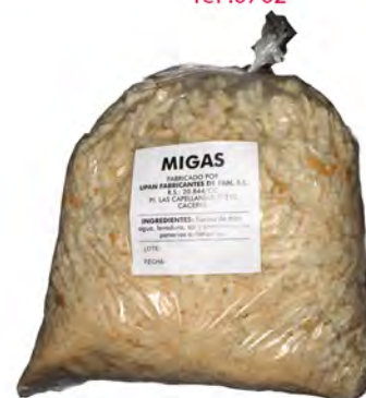
Bolsa de migas 600 gr. ref: 0070