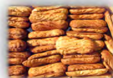
Lottos integral ref: 0932