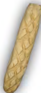
Fabiola de picos ref:1000