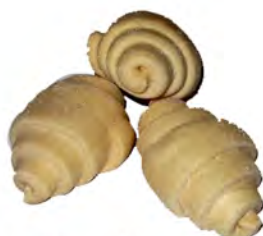
Mini croissant 5 kg ref: 0370