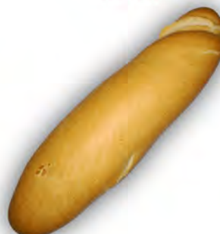
Pepito 140 gr. ref: 0006