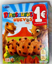
Dinosaurius huevos 1 € ref: 1263