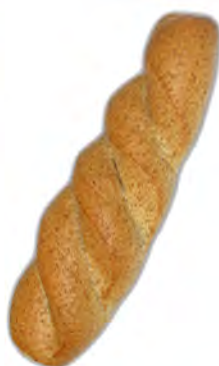
Libra integral 330 gr. ref: 0011