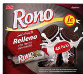
Rono cacao 1 € ref:1277