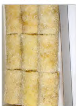
Trabucos 9 uds. ref: 1211