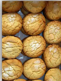
Perrinillas ref: 0665