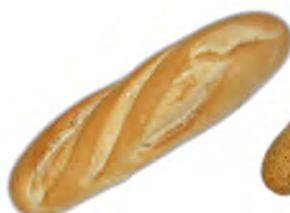
Ración viena 140 gr. ref: 0183