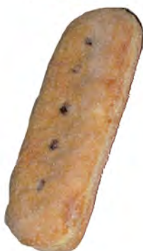
Suso bombón ref: 1100