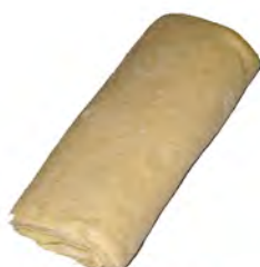
Napolitana crema ref: 0371