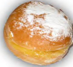
Bamba de crema ref: 1222