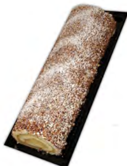
Brazo de crocanti ref: 1292