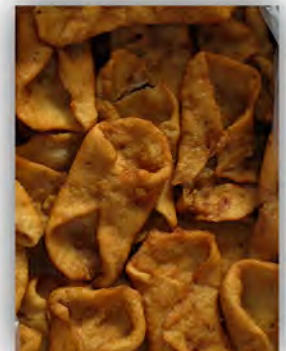
Pestiños miel ref: 0699