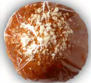
Tosta dulce ref: 1301