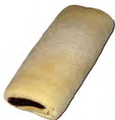
Napolitana choco ref: 0372