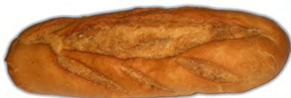
Pan de centeno de 500 gr. ref: 0189