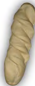
Libra de Cáceres ref:002