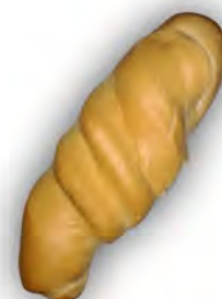
Coloncito 220 gr. ref: 0196