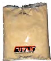
Pan rallado 250 gr. ref: 0077