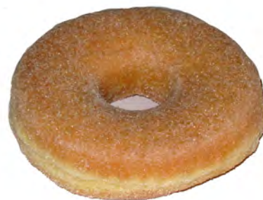
Redondo de azucar ref: 0222