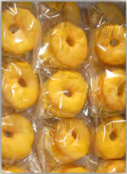
Rosca yema individual ref: 0681