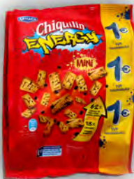
Chiquilin energy 1 € ref: 1265