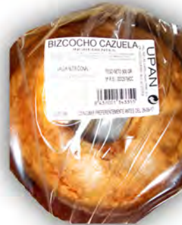
Bizcocho cazuela ref: 0694