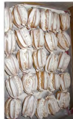
Bocaditos de nata 1 Kg ref: 0970.