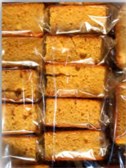
Bizcocho de naranja sin lactosa ref: 1253