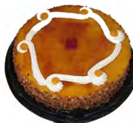
Tarta San Marcos ref: 1299