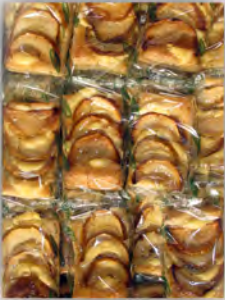
Tarta de manzana sin azucar ref: 1242