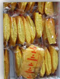
Bolluela sin azucar ref: 1252