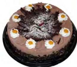
Tarta de trufa y nata ref: 1300