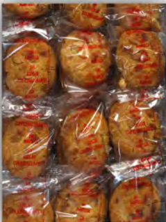
Perrunillas sin azucar ref: 0689