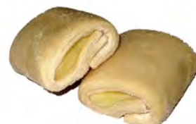
1/2 Napolitana crema ref: 0192