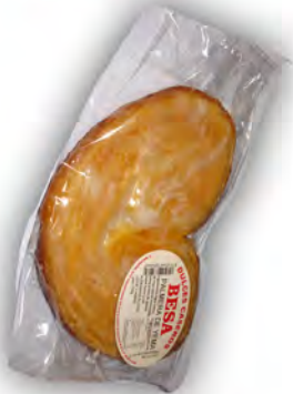
Palmera de yema ref: 0508