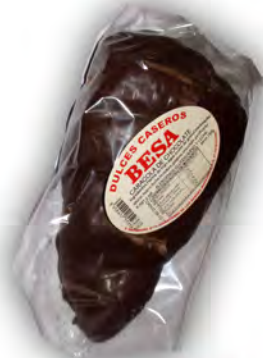
Caracola de choco ref: 1217