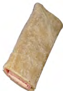
Napolitana de jamon york ref: 0156