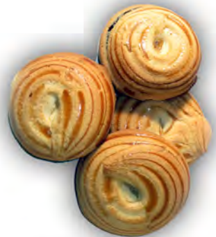
Diana rellena de cacao ref: 0934