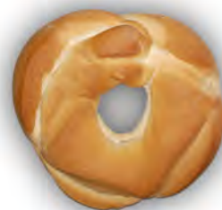
Libra rosca 330 gr. ref: 0025