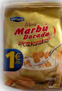
Marbú tradicional 1 € ref: 1260