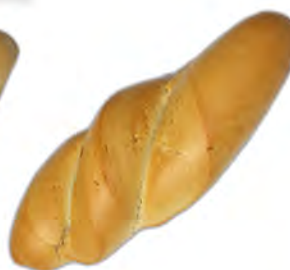
Ración sosa 150 gr ref: 0034