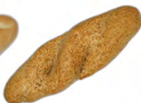
Ración integral 150 gr ref: 0049