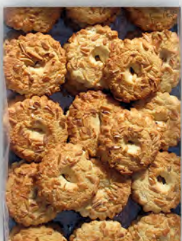
Roscas de almendra ref: 0666