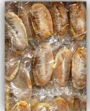
Barco de crema ref: 0663