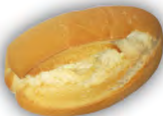
Bollo blanco 90 gr ref: 0005