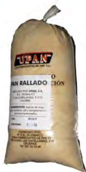
Pan rallado 1 kg. ref: 0078