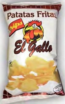
Patatas fritas el Gallo ref: 1207