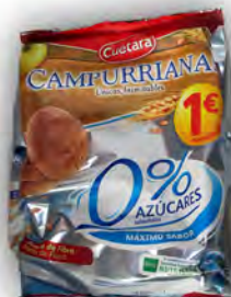
Campurrianas 1 € ref: 1259