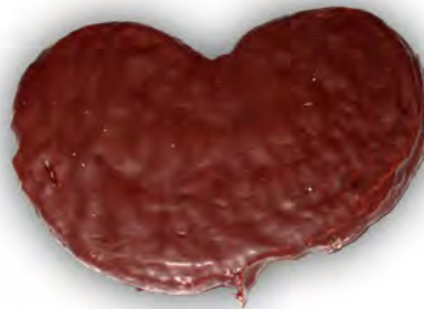
Palmerón choco ref: 1225