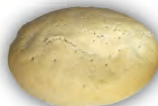
Mollete upan 140 gr ref: 0175