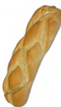
Libra cantona refractaria 330 gr. ref: 0198