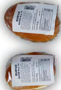
Suizo individual ref: 0514