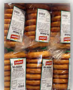
Rollos naranja sin azucar ref: 0941