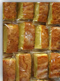
Bizcocho cortado individual ref: 0674