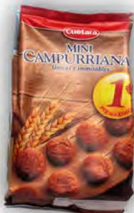
Minicampurrianas 1 € ref: 1258