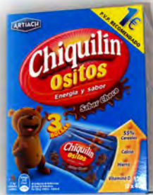
Chiquilín ositos 1 € ref: 1256