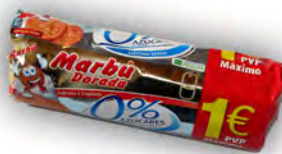
Marbú 1 € sin azucar ref: 1261