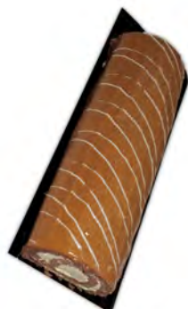
Brazo de dulce de leche ref: 1293