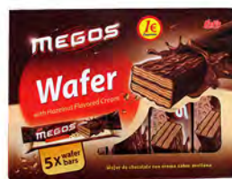
Megos cacao 1 € ref:1274