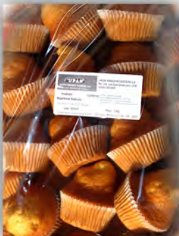
Magdalena el Cruce ref: 0058