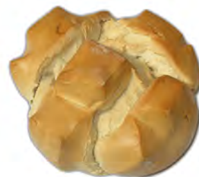
Libra redonda 330 gr. ref: 0027