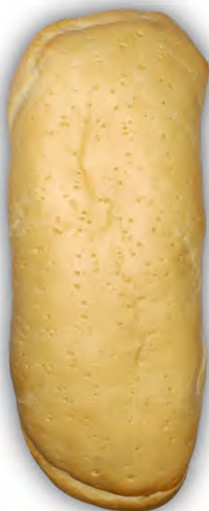
Chapata grande 1.000 gr. ref: 0041