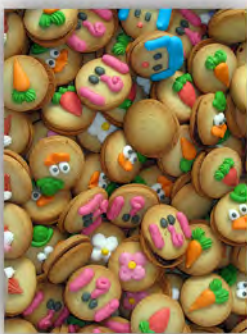
Galleta pequeña decorada granel ref: 0930