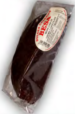
Medialuna de crema y choco ref 1218