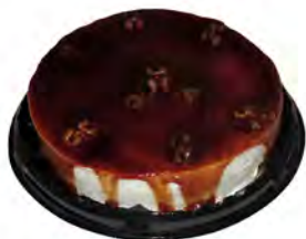
Tarta de nata y nueces ref: 1296