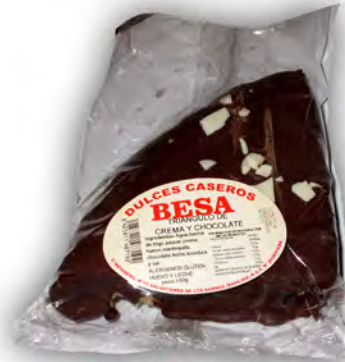
Triángulo de crema y choco ref: 1223