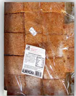
Bizcocho de almendra ref: 0778