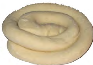
Ensamada ref: 0515