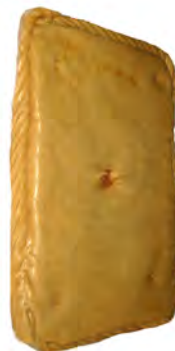
Empanada de atún ref: 0601