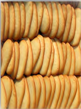
Paletinas ref: 0935