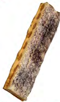
Banda de tiramisú premium ref: 1290