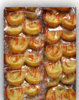
Palmera glass sin azucar ref: 1315