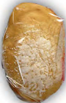
Antojos el Cateto ref: 0976