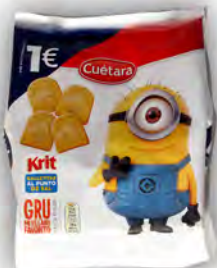
Krititas 1 € ref: 1264