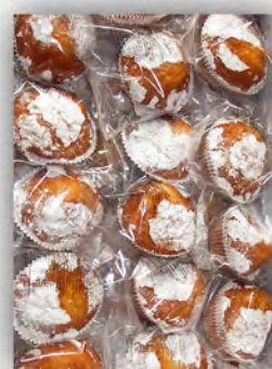
Magdalena de nata San Antón ref: 0646