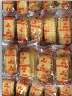
Galleta rizada sin azucar ref: 0684