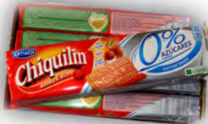
Chiquilin sin azucar ref: 1255