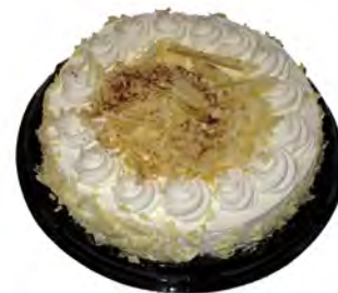
Tarta Duquesa ref: 1295