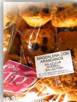
Magd. con arándanos s. a. y sin lact. ref: 1302