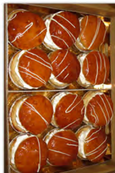
Borrachos de nata ref: 1210