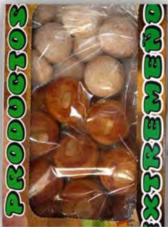
Surtido extremeño ref: 0559