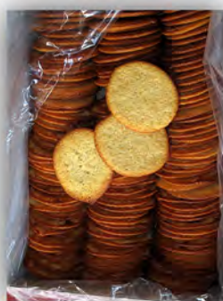
Tortas SM3 ref: 0929