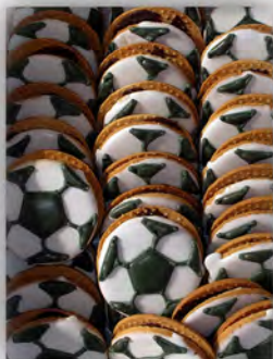
Galletas grandes con motivos ref: 0843