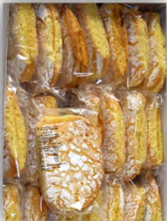
Bolluelas ref: 1229