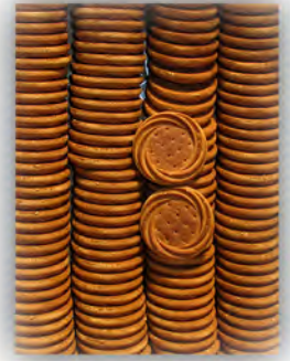
Torta de sésamo ref: 0786