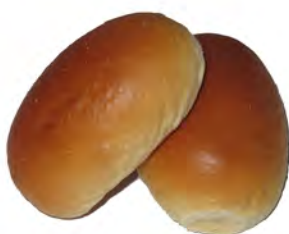
Media noche ref: 0518