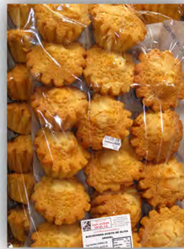
Bizcochada oliva ref: 0670