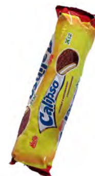
Calipso 1 € ref: 1279