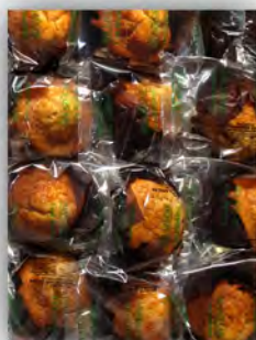
Magdalenas de zanahoria sin azucar ref: 0863