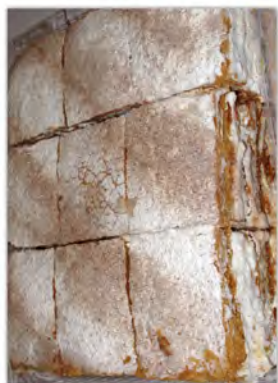
Milhojas de de de nata 9 uds. ref: 1212