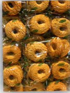
Roscas maltitol sin azucar ref: 0649