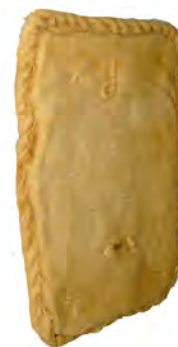
Empanada de pollo y champiñones ref: 0602