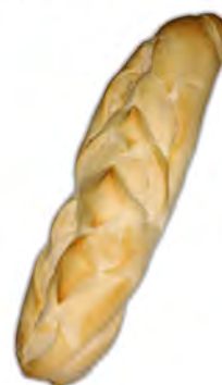
Libra cantona blanca 330 gr. ref: 0178