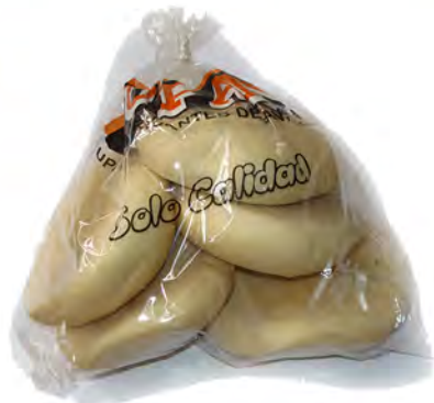
Bolsa de molletes (5 uds.) ref: 0176