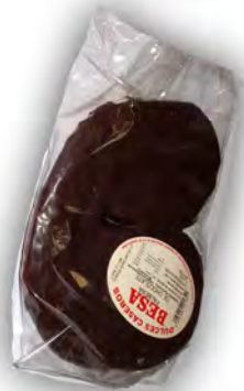
Palmera de choco ref: 0516