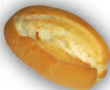
Bollo pequeño 50 gr ref: 0042