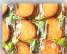
Torta integral de leche sin azucar ref: 0975