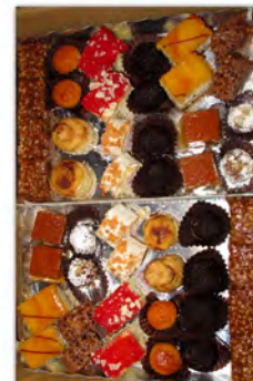
Minipasteles 48 uds ref: 0505