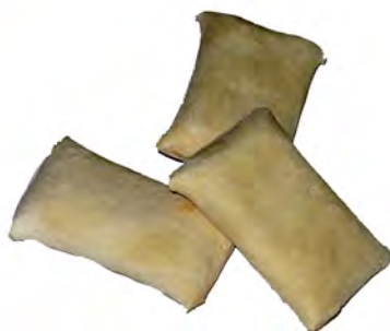
Minisaladitos ref: 0151