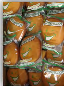
Desayunos sin azucar ref: 0983