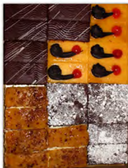
Surtido de Hispanos ref: 1208