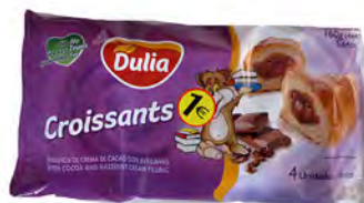
Croissants 1 € ref: 1281