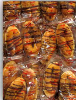
Barco choco sin azucar ref: 1251