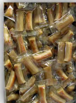
Huesitos de santo ref: 0651