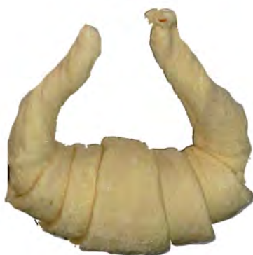
Croissant gigante ref: 0370