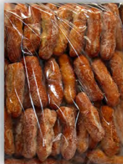
Huesillos ref: 0845