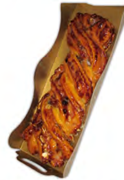
Trenza de frutos secos y pasas ref: 0218