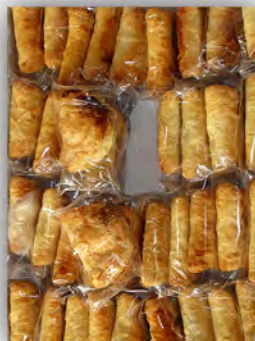
Empanada de hojaldre y crema ref: 1230