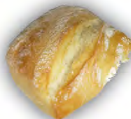
Bollo chapata 60 gr ref: 0165