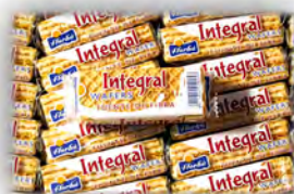
Boer coco integral ref: 0926