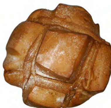
Pan de centeno redondo 500 gr. ref: 189