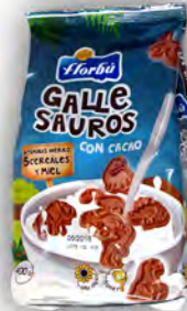
Gallesauros 1 € ref: 1262