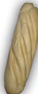
Libra candeal ref:1002