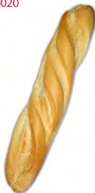
Libra P. cuatro cortes 330 gr. ref: 0195