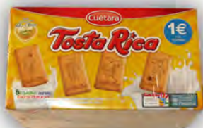
Tosta Rica 1 € ref: 1268