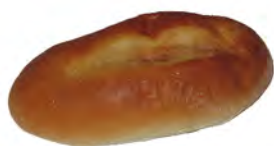
Bollo suizo ref: 0514