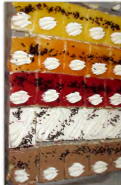
Pastel surtido fino 2 kg ref: 0969