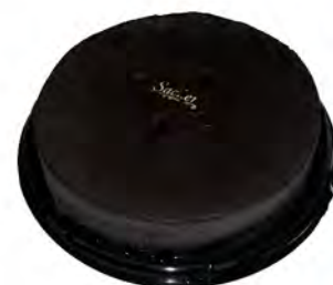
Tarta Sacher ref: 1297