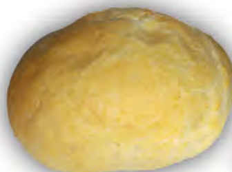
Hamburguesa 140 gr. ref: 0008