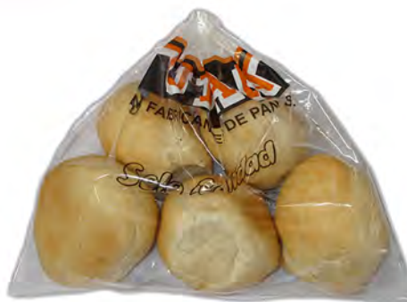
Bolsa de papos (5 uds.) ref: 0017