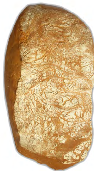
1/2 Chapatón ref: 0187