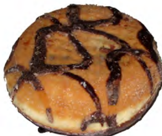
Berlina Choco ref: 1102