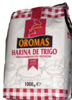
Harina 1 kg: ref: 0075