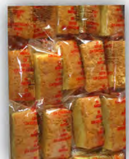
Bizcocho cortado sin azucar ref: 0682