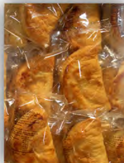
Empanadilla cabello ref: 0692