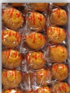
Magdalena sin azucar ref: 0687