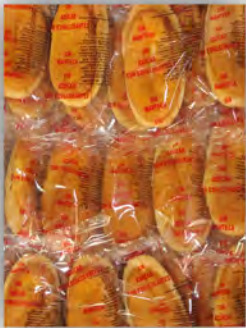
Barco de crema sin azucar ref: 1250