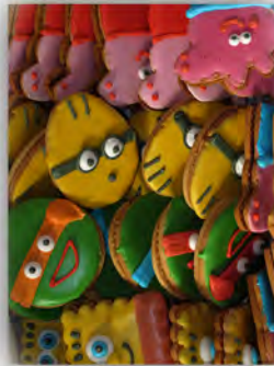
Galletas decoradas grandes ref: 0843