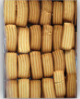
Galletas de vainilla ref: 1227