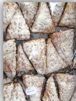
Triángulo choco el Cateto ref: 0977