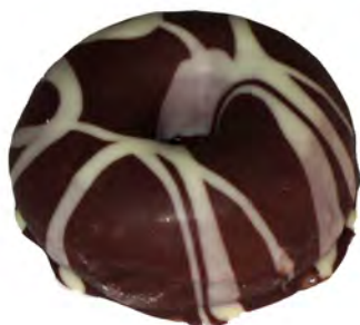
Koala ref: 0344