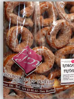
Roscas fritas ref: 0658