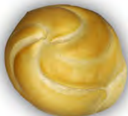
Alcachofa 80 gr. ref: 0009