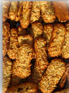
Palita de almendra relleno cacao ref: 0093