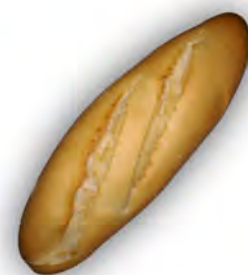
Ración 150 gr. ref: 0003