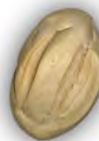
Bollo sevillano 80 gr ref:0262