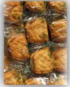
Empanadilla cabello ángel maltitol ref: 1247