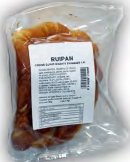
Croissant individual ref: 0498