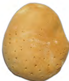
Gallego 330 gr. ref: 0020