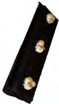
Banda de galleta ref: 1289