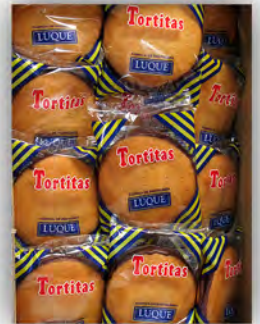
Tortitas de choco ref: 0946