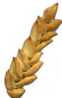
Espiga. ref: 0702