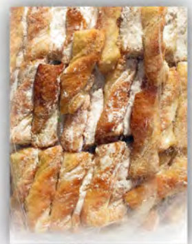
Lazo blanco ref: 0909