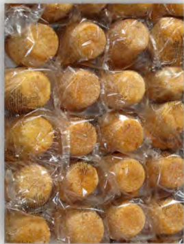
Mojicones de almendra ref: 0669