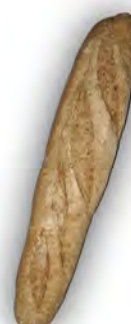
Vienesa integral ref:0108