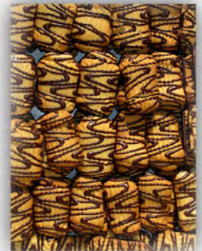
Rizadas mante-choco ref: 0905