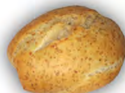
Bollo mediano integral 50 gr ref: 0047