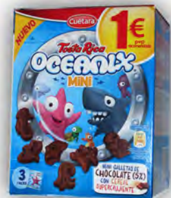
Oceanix ref: 1254