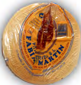
Obleas ref: 0928