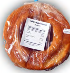
Bizcocho cazuela grande ref: 0657