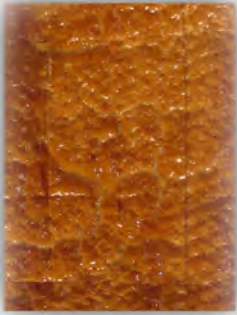
Bayonesa ref: 0903