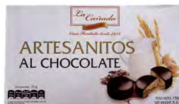
Artesanitos al chocolate 1 € ref: 1278