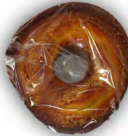
Bizcocho cazuela con almendra ref: 0693