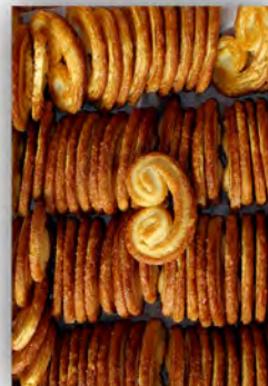
Palmeritas de hojaldre ref: 0906