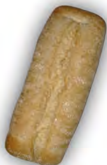
Chapata de 400 gr ref:0102