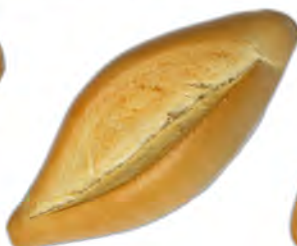
Ración de pueblo 150 gr ref: 0033