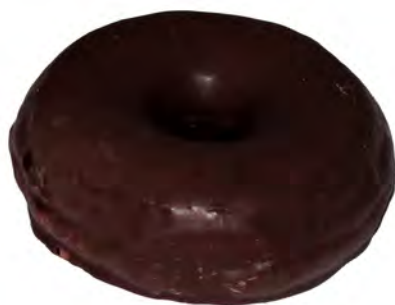
Redondo de chocolate ref: 0223