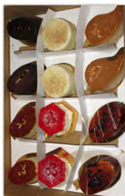
Surtido de postres de 12 uds. ref: 0133