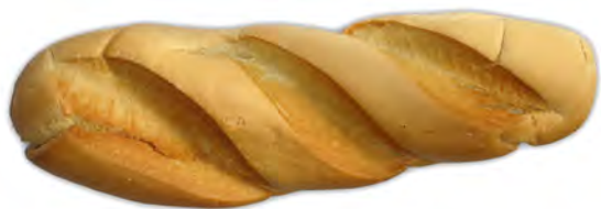
Pan pueblo tres cortes 490 gr. ref: 0019