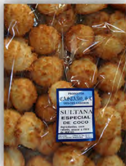
Sultana de coco ref: 0062