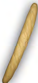
Baguette 250 gr ref:0100