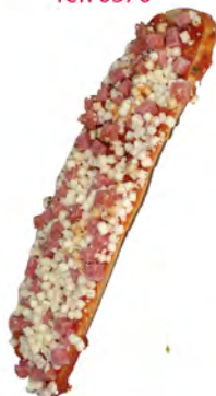
Panini york y queso ref: 0840