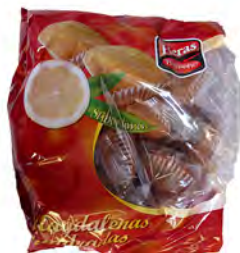
Magdalenas de limón 1 € ref: 1273