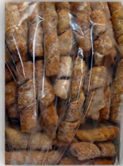
Tirabuzones ref: 0425