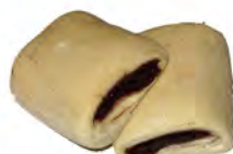
1/2 Napolitana choco ref: 0191