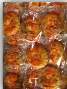
Rosca de almendra sin azucar ref: 1248