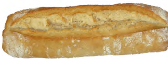
Chapata 400 gr. ref: 0015