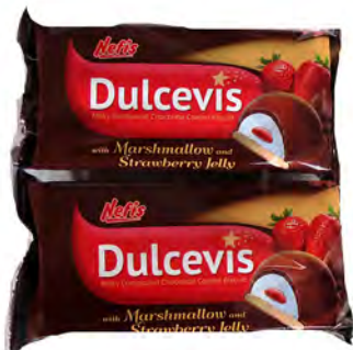
Dulcevis pack 2 1€ ref: 1282