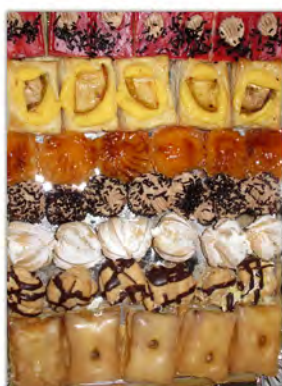
Estuche grande de pasteles ref: 0861