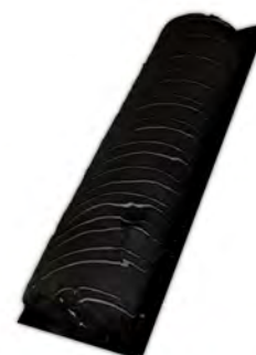
Brazo de bombón ref: 1291