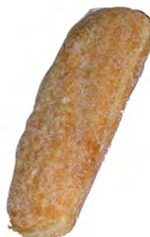
Suso crema ref: 1101